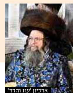
ארכיון עזר ויהודר