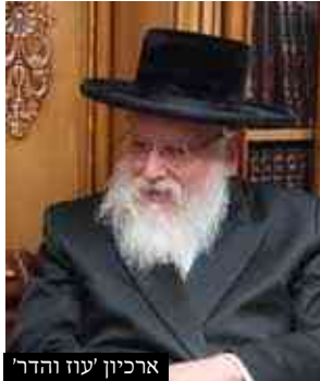
ארכיון עוז והדר

ח. ומ"מ בנידו"ד י"ל דהמחשב עדיף מקולמוס, שהרי מלבד היותו כלי כתיבה, הרי הוא משמש כיום כ'אוצר ספרים' עצום, והרי הוא כנידון של הנחת 'ספר על גבי ספר' שהתירו הפוסקים (כ"ל אות ה), וכל שכן בזה שהנחתו היא לצורך הלימוד בספר התחתון או במחשב עצמו. וכן מצאתי בספר גנזי הקודש (פ"ג סעי' כד) בשם הגר"נ קרליץ זצ"ל שמותר להניח עט על הגמרא לצורך הלימוד. וא"כ ה"ה למחשב, דלא גרע מיניה.