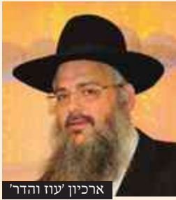
ארכיון עוז והדר

הגאון רבי שלמה לוינשטיין שליט"א: כשבו מתפילתן, התעניין השומר אודות פשר העניין, והן ספרו כי בתה של אחת מהן ירדה מן הדרך ועמדה להתחתן עם גוי, וככל שניסו להשפיע עליה - אטמה את ליבה משמוע. אמש הגענו ובכינו בסמוך לקברו של הש"ך - סיפרו הנשים - והנה, כששבנו הביתה נודע לנו שאותו גוי נהרג... באנו, אפוא, לומר תודה ליד קברו.