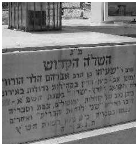
העדה בירושלים. גדולי הדור כינוהו "מרא דארעא