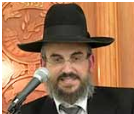
"באתי ללמוד בשייבה". - "באת לשייבה???"

הסטודנט לא האמין למשמע אזניו. הרצון שלו להגיע לשייבה ולעמוד על טיבה, התחזק פי כמה וכמה. הוא נסע לליקווד (לבדוק את העניין, ונשאר שם. היום הוא אברך בירושלים, יש לו ב"ה אשה וילדים, משפחה חרדית לתפארת. וממה התחיל הכל? מהלבוש של בן השייבה, שהלך עם כובע וחליפה בוונצואלה. "שהיו מצויינים שם..." (מתוך הגדה של פסח 'דורש טוב)