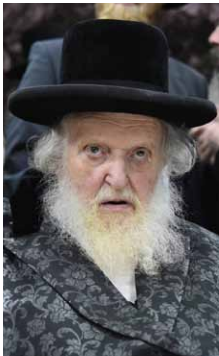
בח"ב סימן תקנ"ב.

והטעם נראה שלכתחילה צריך לבטל המזוזה לבית, ולכן מצות התורה לקובעו, והיינו באופן שקובעים בקביעות והיינו בדבק ממש. אבל בנייר דבק מלמעלה ומלמטה לבד, שאינו נופל אבל לא נתבטל כחלק מזוזת הבית לכתחילה אין לעשות כן, אבל בדיעבד מהני, וכדמשמע בדברי הב"ח בסיומן רפ"ט ד"ה תלאה: "במקל ולא קבעה פסולה כו" וקאמר בגמ' מ"ט בשעריך בעינן, פירוש בשעריך משמע שיקבענה בשעריך "ההרי לא קבעה שתהא נחה ולא תלויה ומתנדנדת באויר הפתח" עכ"ל. ומבואר שאין הפסול משום שצריך קבוע בשער, אלא משום דבעינן "נחה" ולא "מתנדנדת", ולפי"ז פשוט שבנייר דבק כשר, כיון שאינו מתנדנד אבל לכתחילה יש לקובעו בחיבור גמור וכמ"ש, ועיין בערוך השולחן ס' רפ"ט סעיף ט"ו שמתיר בדבק.