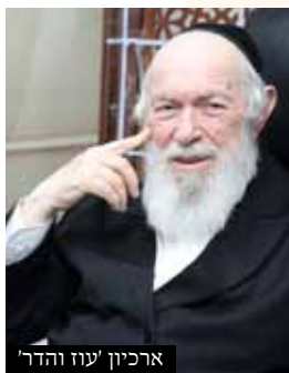
ארכיון 'עוז והדר'

לחדשו ולכבסו וכיוצ"ב. אכן יש לציין שכל דברי הנצי"ב אמורים לשיטת רש"י, הסובר שהמסך הוא הפרוכת, אכן האבן עזרא שם כתב שהמסך הוא הפרוכת שלפני הפתח אהל מועד, ולשיטתו אין ראייה לענייננו, אבל מאידך גם אין ראייה שהוא חולק על עצם היסוד, שהממונה על ארון הקודש אינו בהכרח ממונה על הפרוכת שיש לגביו אחריות מסוג אחר.