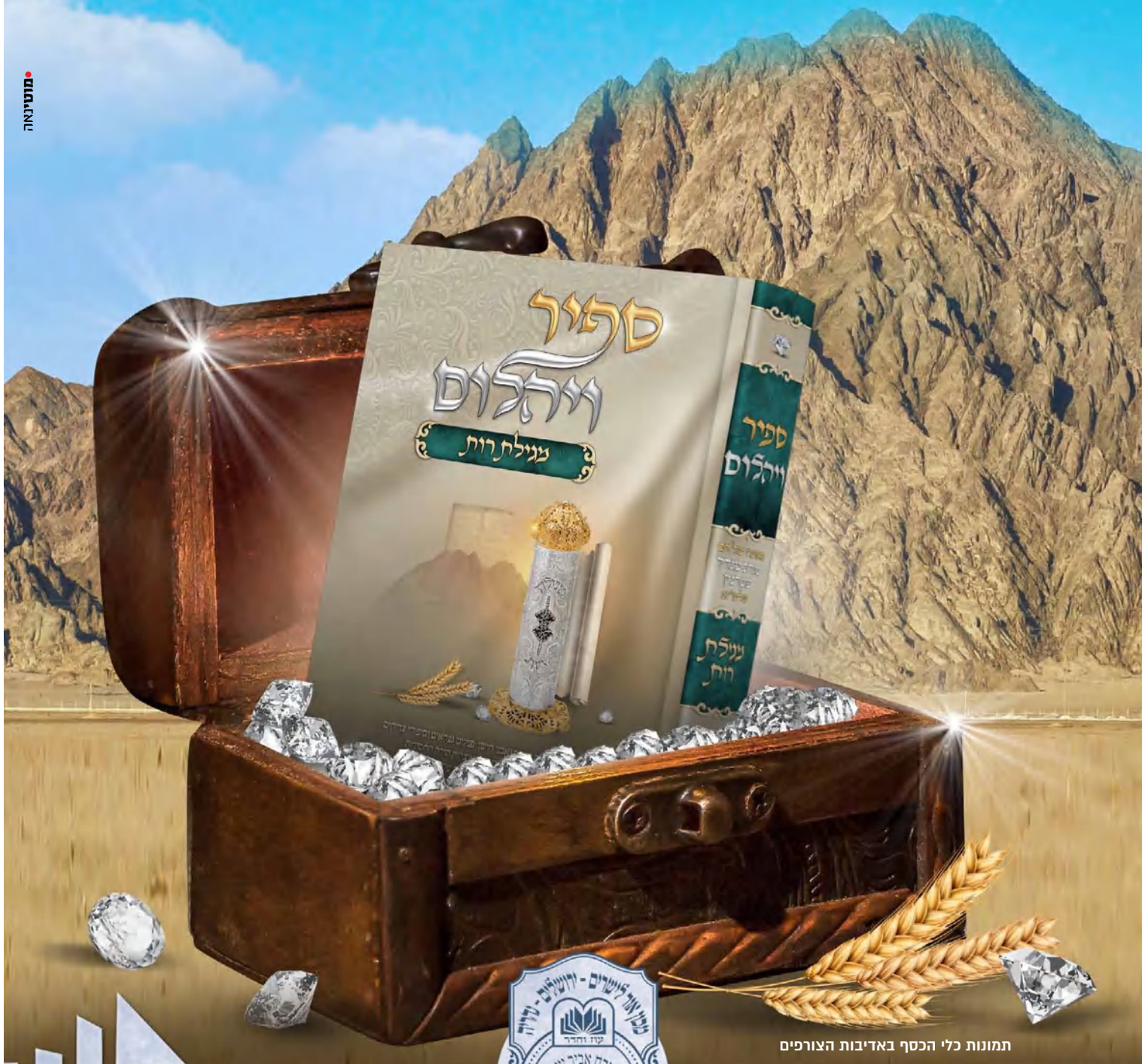
תמונות כלי הכסף באדיבות הצורפים