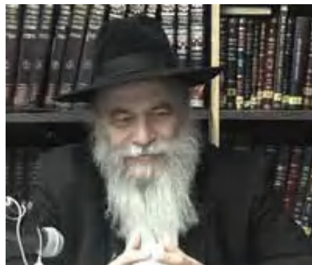
התפילה וקיום מצוות ה'.

בשביל להתרומם ברוחניות, חייבים להתנתק מהבלי העולם, התנאי להצלחה ברוחניות הוא ההתדבקות בבורא העולם, השקיעות בלימוד התורה, והדבקות בקיום המצוות!